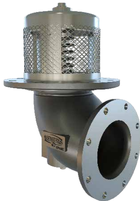
Ventris 紧急切断阀 VEV100 (超紧凑型, 出口圆)